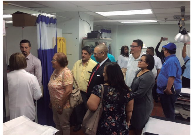
Policlínica "Dr. Hugo Spadafora Franco", Colón.