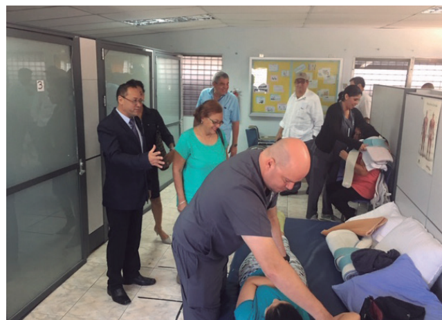
Reunión de la Comisión de Salud en la Policlínica de Boquete.