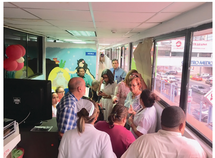
Comisión de Salud en reunión de trabajo, en el Hospital de Especialidades Pediátricas " Omar Torrijos Herrera".