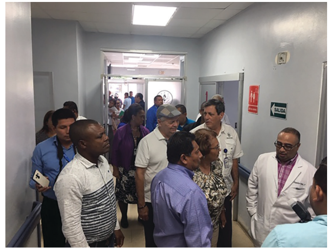
Recorrido en el Hospital de Changuinola