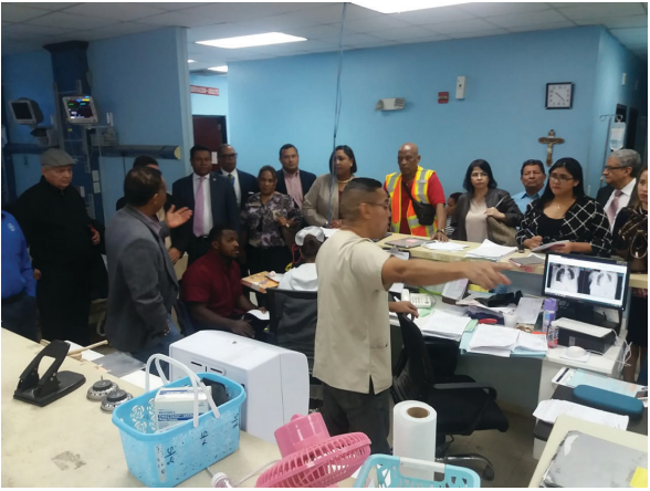
Cuarto de Urgencia del Hospital de Colón