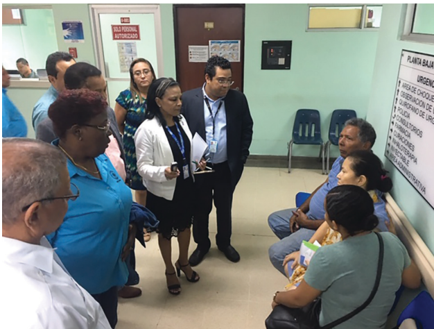
Recorrido por las instalaciones del Hospital “Dr. Gustavo Nelson Collado” de Chitre.