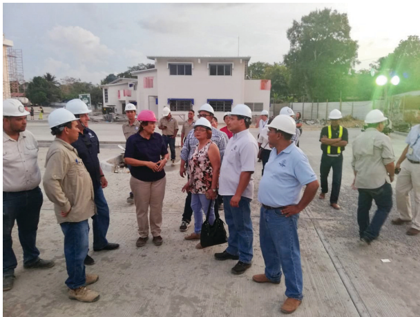
Hospital de Puerto Armuelles (Nuevo)