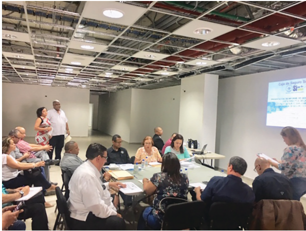
Policlínica Nuevo San Juan (Construcción)