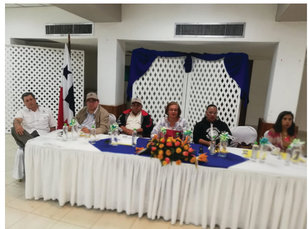
Reunión de la Comisión de Salud, Volcán.