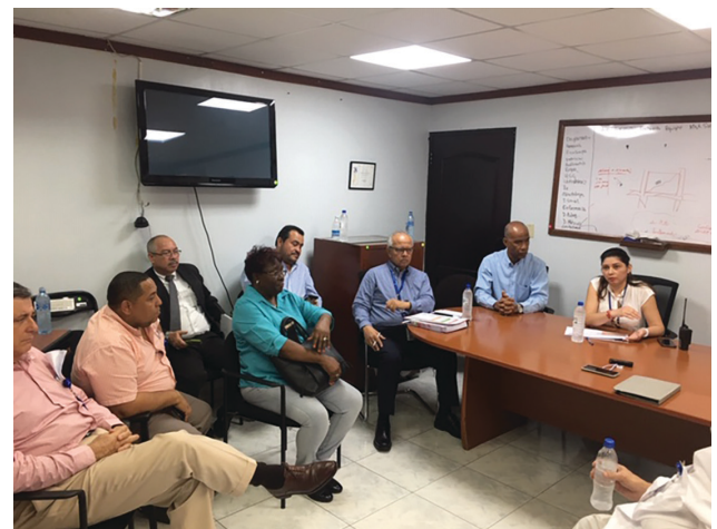
Reunión de trabajo en la Policlínica “Presidente Remón” de calle 17, de la Comisión de Salud, con las autoridades médicas y administrativas.