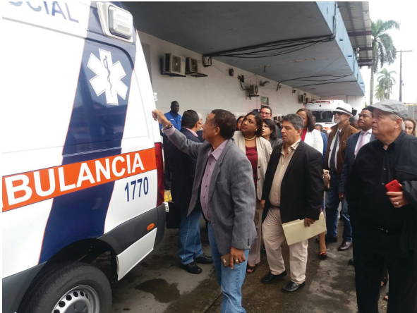
Hospital "Dr. Manuel A. Guerrero"