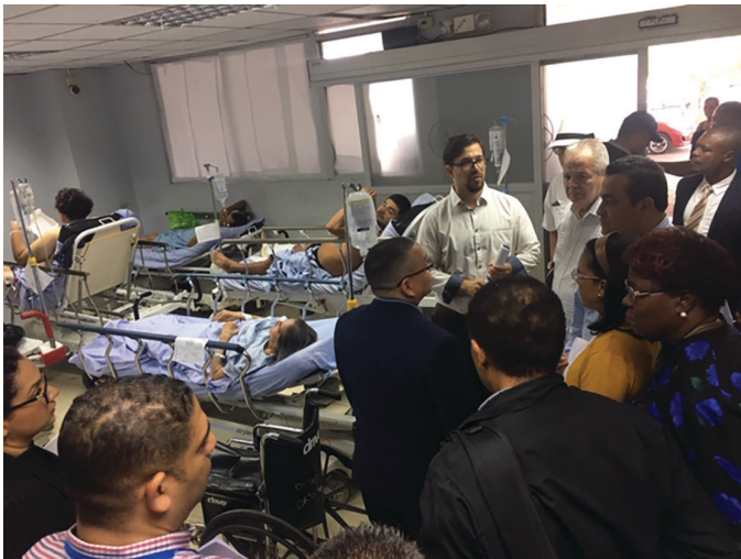
Recorrido por el cuarto de urgencias del Hospital "Dr. Rafael Hernández L.", en David.