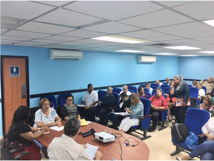
Hospital "Dr. Manuel A. Guerrero", de Colón.