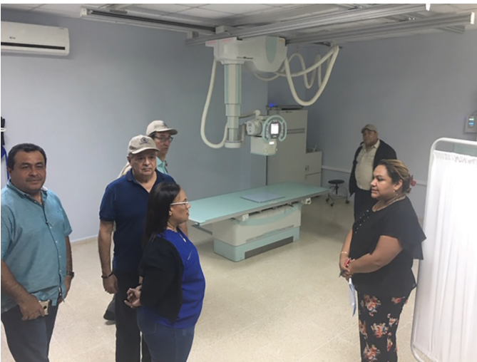
Casa del Pensionado Metropolitana