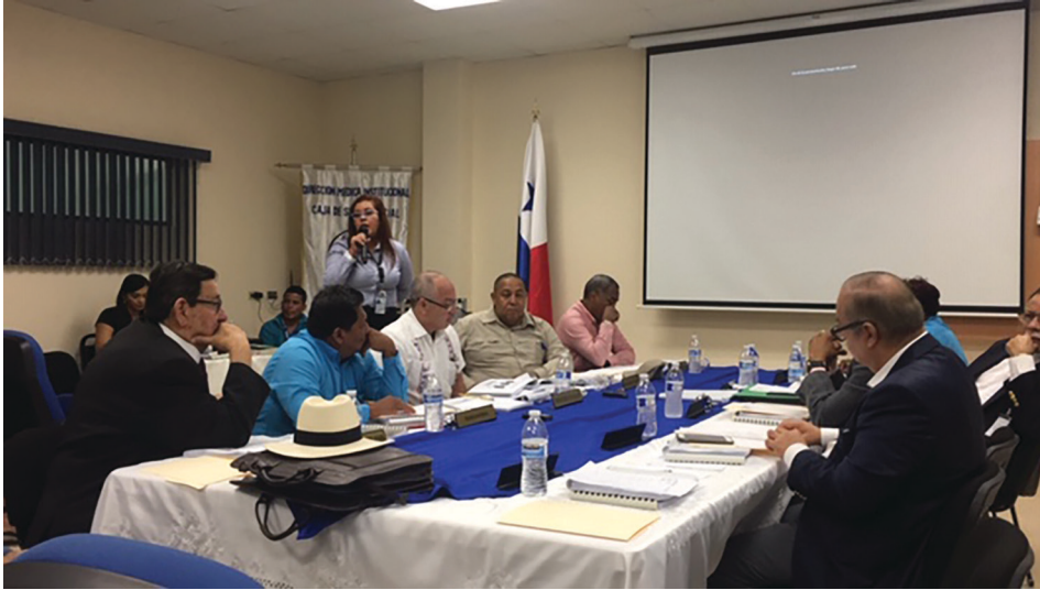
Los honorables miembros de la Junta Directiva, sesionan y se reúnen con autoridades de las unidades ejecutoras de hospitales, policlínicas, Ulaps y Caaps de la provincia de Herrera.