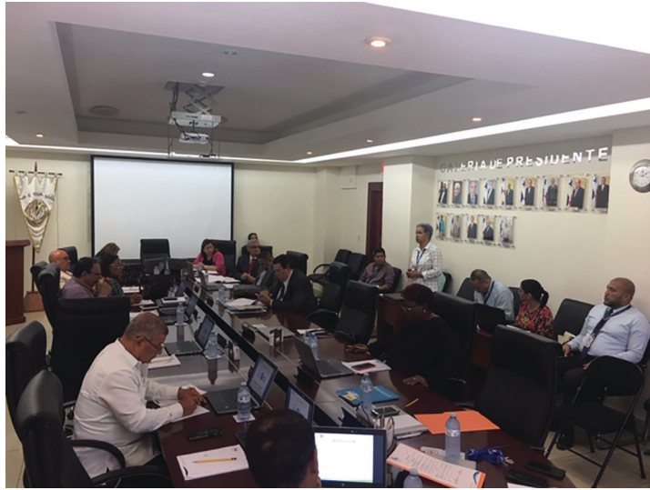
Pleno de Junta Directiva, atiende en cortesía de sala a dirigentes gremiales de la institución.