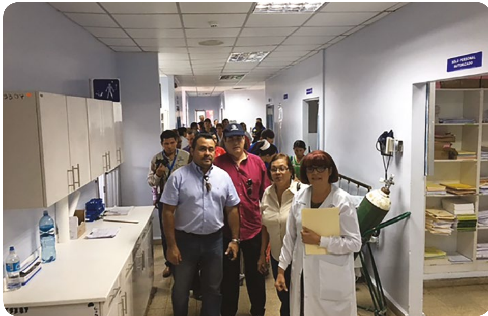
RECORRIDO Y REUNIÓN DE TRABAJO DE LOS MIEMBROS DE LA COMISION DE SALUD DE LA JUNTA DIRECTIVA, EN LAS POLICLINICAS Y ULAPS DE LA PROVINCIA DE CHIRIQUÍ.