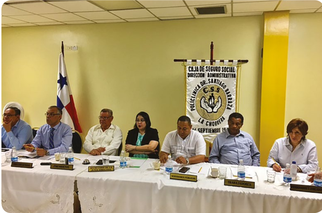
REUNIÓN EXTRAORDINARIA DE LA JUNTA DIRECTIVA, CELEBRADA EN LA PROVINCIA DE OESTE, AGOSTO 2017. PARTICIPAN AUTORIDADES NACIONALES, PROVINCIALES.