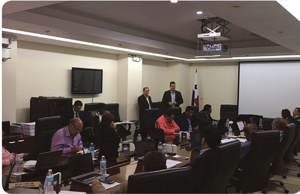
IMPORTANTES REUNIONES EXTRAORDINARIAS DE LA JUNTA DIRECTIVA CON MIEMBROS DE LA JUNTA TÉCNICA ACTUARIAL Y AUTORIDADES, 2017.