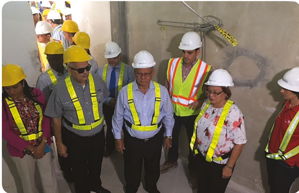
LOS MIEMBROS DE LA JUNTA DIRECTIVA, REALIZAN RECORRIDO A LAS NUEVAS TORRES QUIRÚRGICAS DEL HOSPITAL REGIONAL DE DAVID, DR. RAFAEL HERNANDEZ. MARZO 2018.