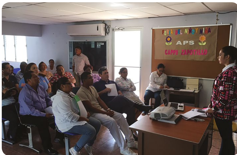
REUNIÓN DE TRABAJO DE LA COMISIÓN DE SALUD, EN LA CAPPS DE ZAPOTILLO