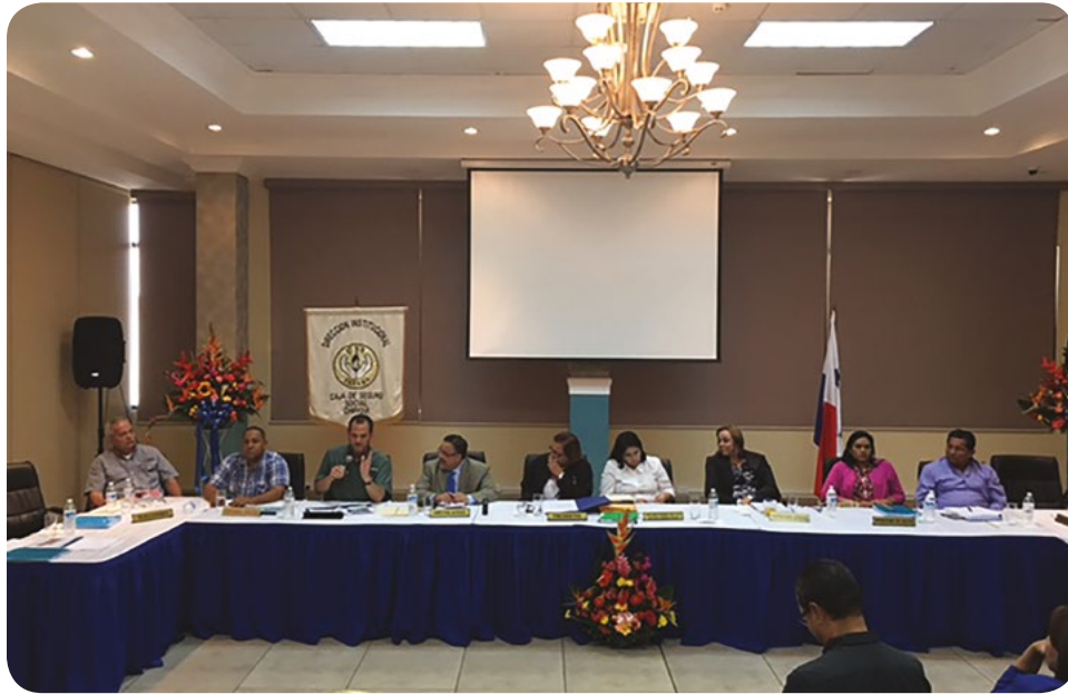
REUNIÓN EXTRAORDINARIA DE LA JUNTA DIRECTIVA, CELEBRADA EN LA PROVINCIA DE CHIRIQUÍ, MARZO 2017. PARTICIPAN AUTORIDADES NACIONALES, PROVINCIALES Y EL CONTRALOR GENERAL DE LA REPÚBLICA.