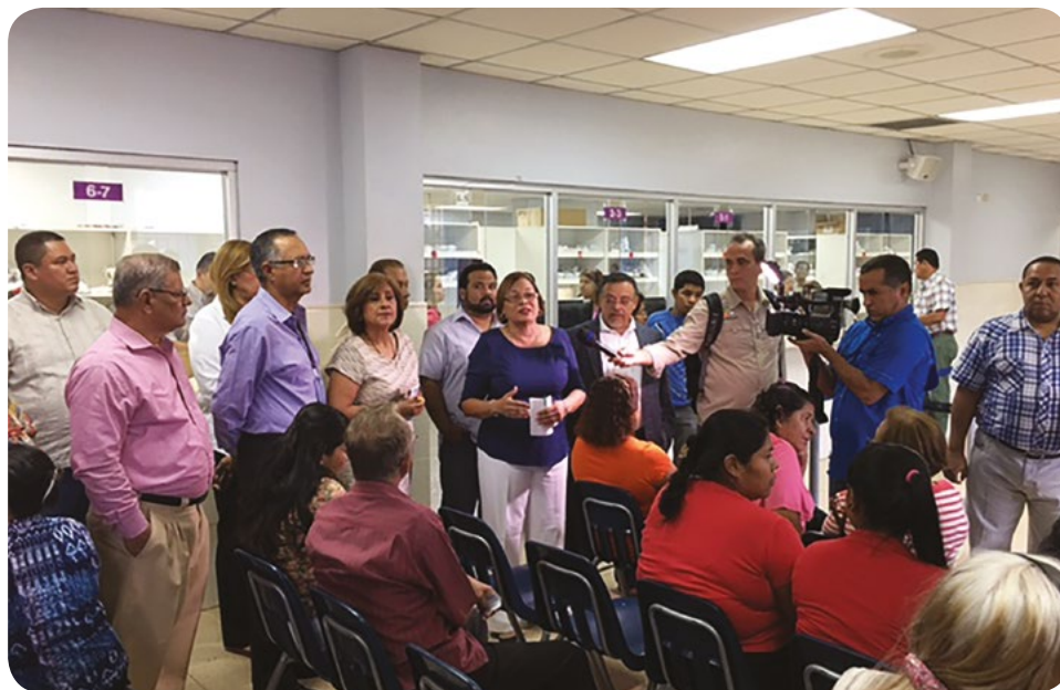
LOS MIEMBROS DE LA JUNTA DIRECTIVA PARTICIPAN DE REUNIÓN EXTRAORDINARIA DE LA JUNTA DIRECTIVA, EN LA PROVINCIA DE VERAGUAS, EN ENERO DE 2017.