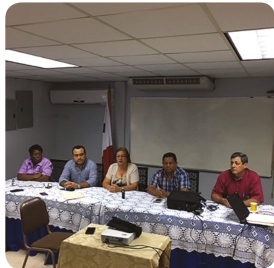
LOS MIEMBROS DE LA JUNTA DIRECTIVA REALIZAN REUNION DE TRABAJO EN LAS INSTALACIONES DE LA POLICLÍNICA SANTIAGO BARRAZA DE LA CHORRERA Y LA POLICLÍNICA JUAN VEGA MENDEZ DE SAN CARLOS.