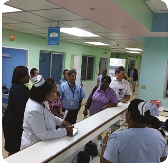
LA JUNTA DIRECTIVA REALIZA IMPORTANTES REUNIONES DE TRABAJO EN EL HOSPITAL DR. MANUELA. GUERRERO Y EN LAS POLICLÍNICAS DE LA PROVINCIA DE COLÓN, NOVIEMBRE DE 2017.