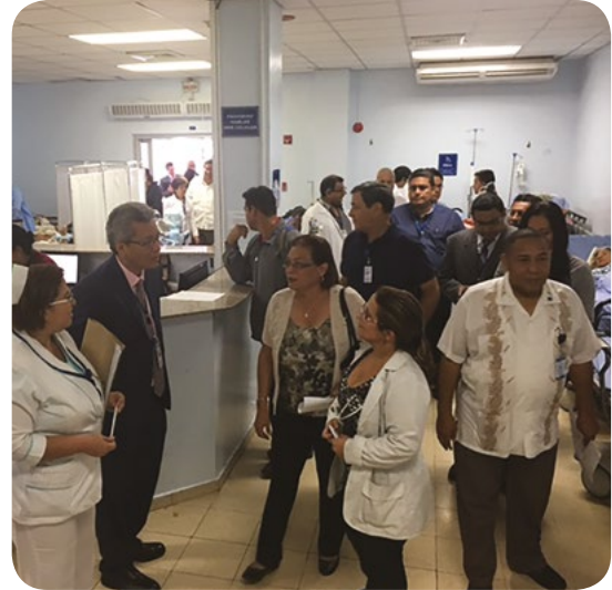
REUNIÓN DE TRABAJO DE LA JUNTA DIRECTIVA Y LA COMISIÓN DE SALUD EN EL COMPLEJO HOSPITALARIO METROPOLITANO DR. ARNULFO ARIAS MADRID, CON ALTAS AUTORIDADES DE LA INSTITUCIÓN DEL ÁREA DE SALUD Y ADMINISTRATIVA, DICIEMBRE 2017.