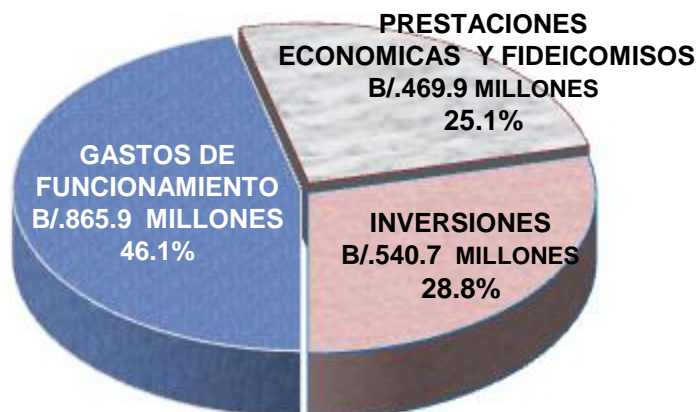
PRESUPUESTO ASIGNADO B/.1,876.5 MILLONES