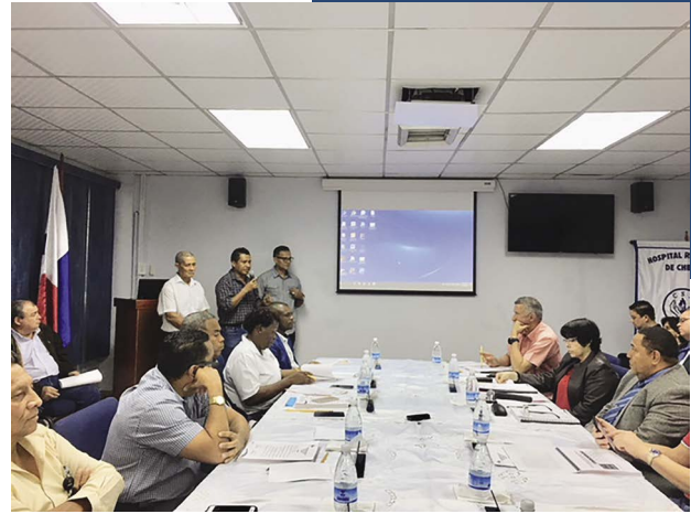
Junta Directiva en Hospital de Chepo