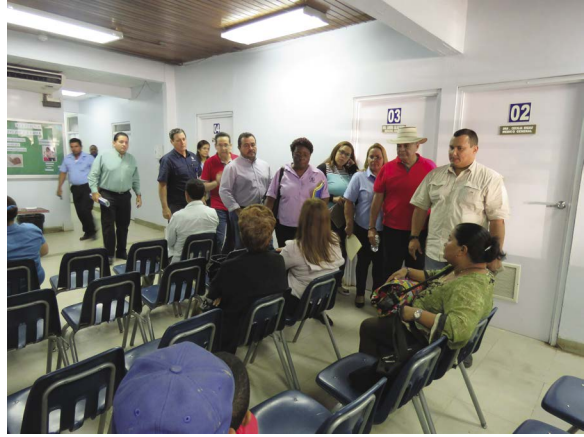
Policlínica de Aguadulce