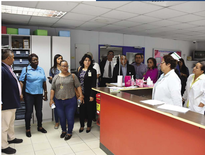
Hospital Dionisio Arrocha