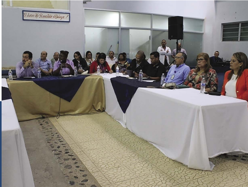
Policlínica Horacio Díaz Gómez