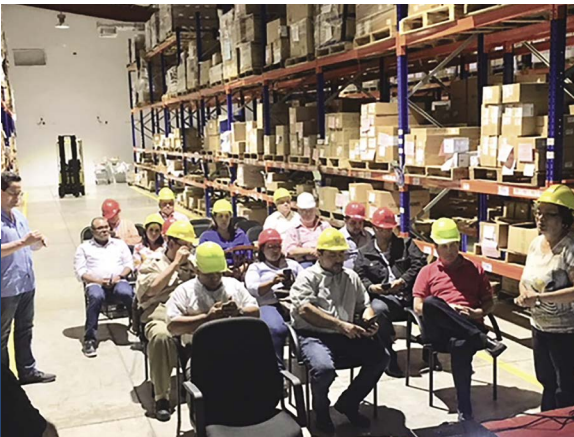
Centro Logístico de Divisa