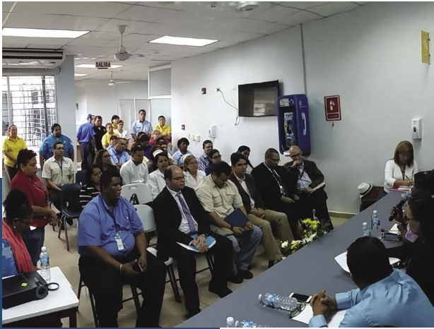
Policlínica de Cañitas