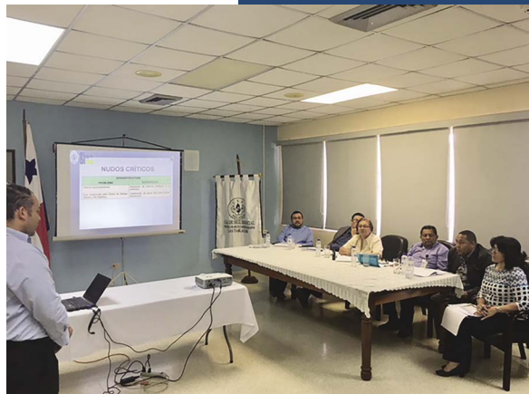
Policlínica Miguel Cárdenas, Las Tablas