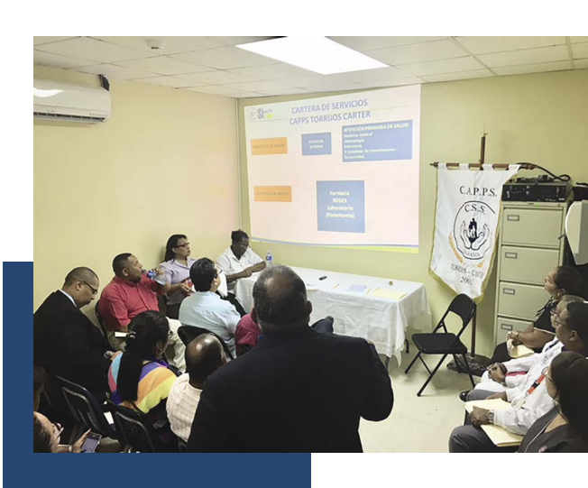
Caaps de Torrijos Carter