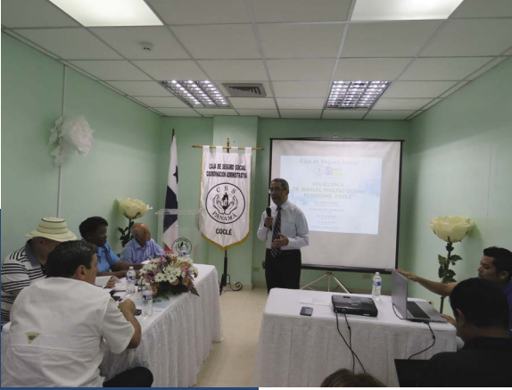
Policlínica de Ponomé