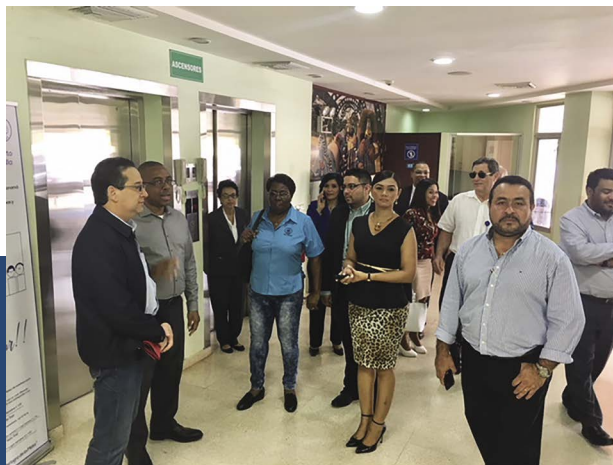
POLICLÍNICA DR. BLAS GÓMEZ CHETRO ARRAIJÁN