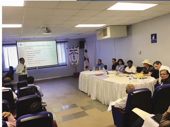
Hospital Rafael Estévez