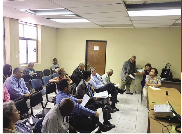
Centro Especializado de Toxicología