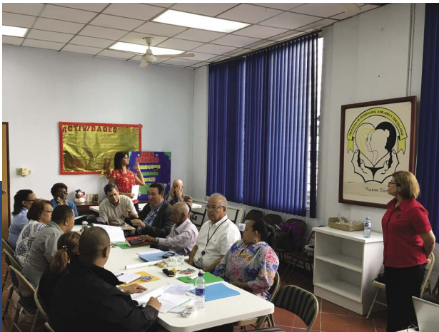
Casa del Pensionado Maximino Sáez