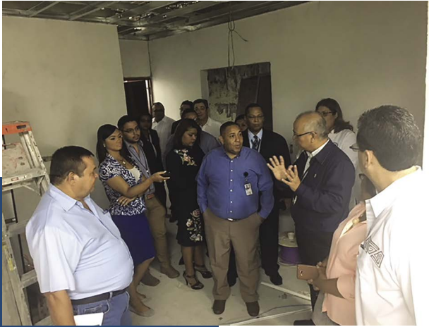
Policlínica Don Alejandro de la Guardia hijo