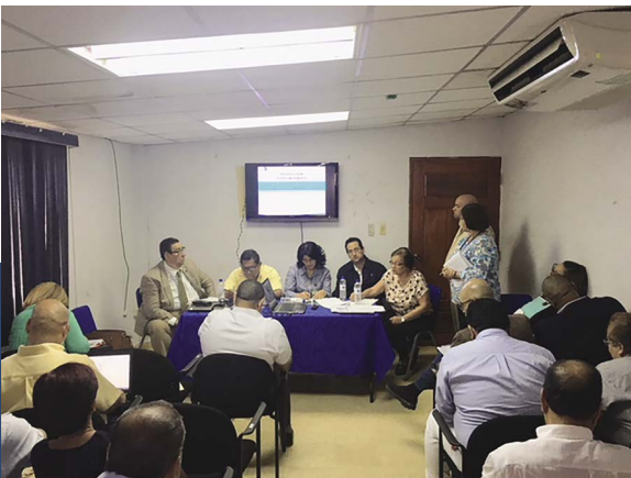
Policlínica de La Villa de los Santos