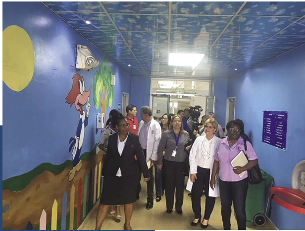
Policlínica Dr. José J. Vallarino