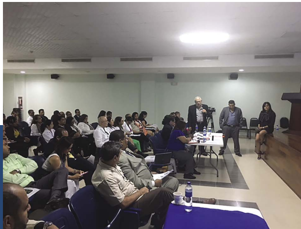
Reunión de la Comisión de Salud Hospital Irma de Lourdes Tzanetatos