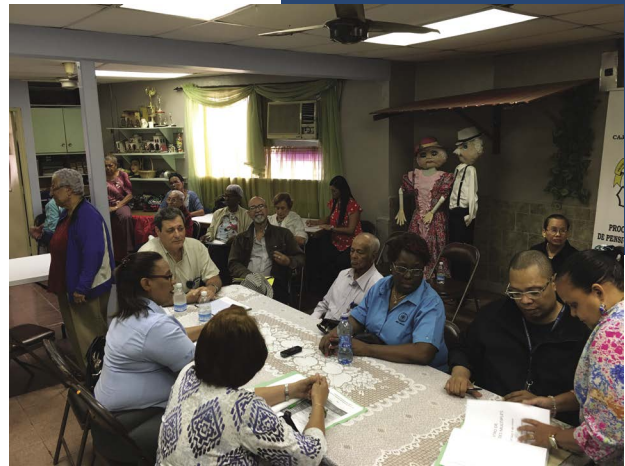
Casa del Pensionado Metropolitana