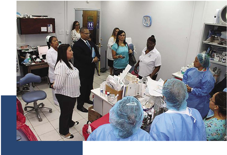
Policlínica Generoso Guardia