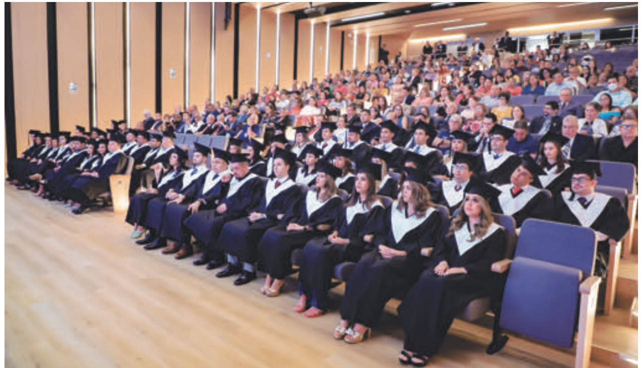
>>La ceremonia de graduación contó con autoridades de la CSS y de la Facultad de Medicina de la Universidad de Panamá.

T reinta y ocho nuevos especialistas y sub-especialistas en diferentes ramas de la medicina reforzarán el servicio de salud de la CSS en el interior del país para suplir las necesidades que, por