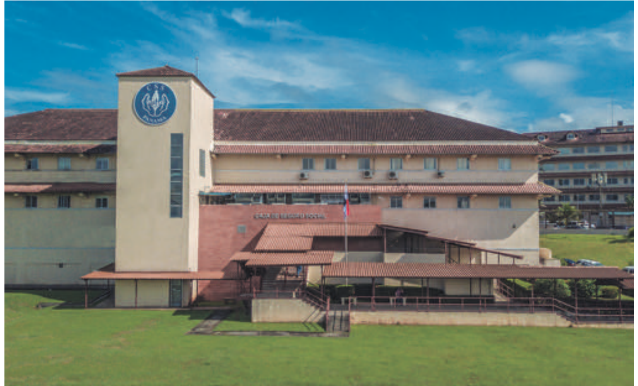
>>La Administración de la CSS ha puesto en ejecución un estricto plan de austeridad en el manejo de sus recursos.