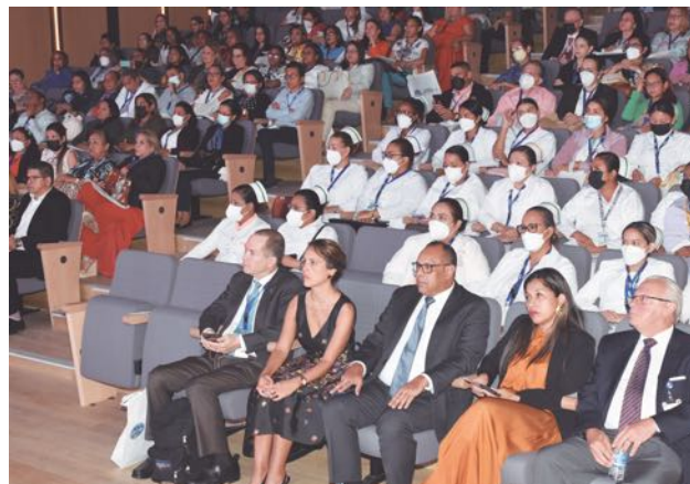
>Exposiciones durante el Congreso Interdisciplinario.