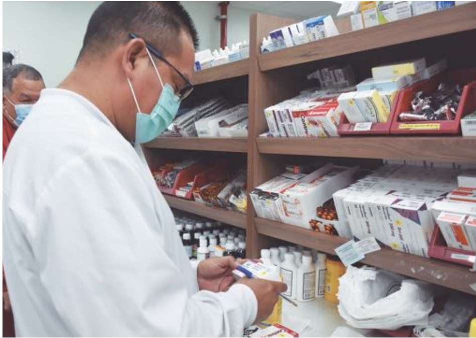
► Las unidades ejecutoras no deben esperar a que les hagan falta medicamentos e insumos.