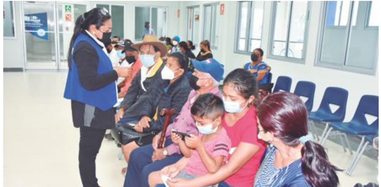
➤Luego de superada la crisis de la pandemia, el volumen de las citas ha comenzado a normalizarse en todo el país.

Más de 37 millones de consultas realizó la Caja de Seguro Social (CSS) a nivel nacional en los últimos cinco años y cuatro meses.