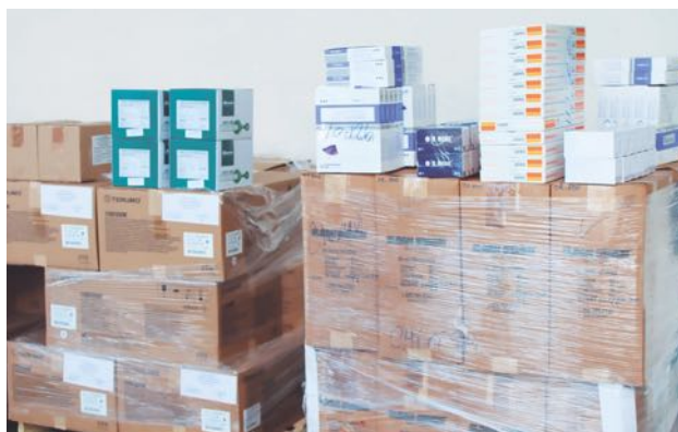
> Los depósitos a nivel nacional se están abasteciendo.