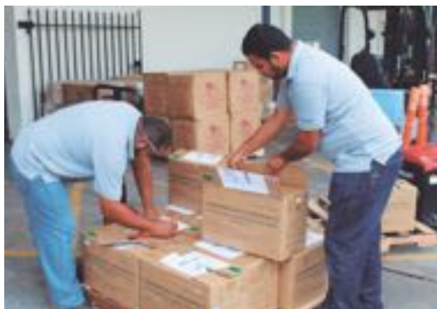
> En Chiriquí existe un abastecimiento para seis meses mínimo. También se transfirieron $5.2 millones para funcionamiento y compra de medicamentos y material médico quirúrgico.