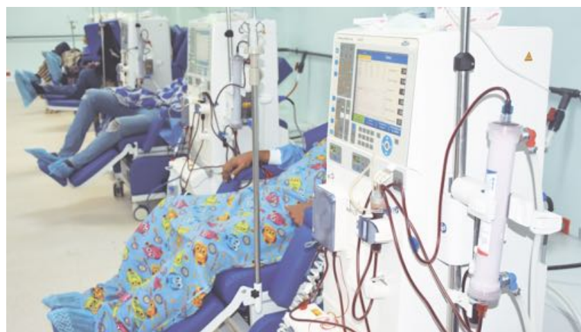
►El número de pacientes de hemodiálisis aumenta de forma sostenida en el país.

“Estrategias implementadas por esta Administración, a través de la Subdirección Nacional de Atención Primaria, como la Cita Única, los Centros de Bienestar y las Clínicas Cardiometabólicas, se han convertido en acciones oficiales importantes para mantener a la