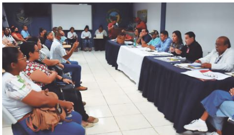
►Reuniones de la Comisión de Alto Nivel que instaló el Ejecutivo.