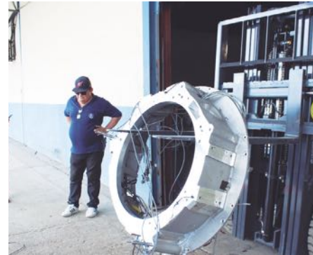
El nuevo tomógrafo está incluido en el proyecto de renovación del

Un tomógrafo computarizado que cumplió su tiempo de vida útil, en el Hospital "Dra. Susana Jones Cano", fue desmantelado para la instalación de un equipo nuevo.